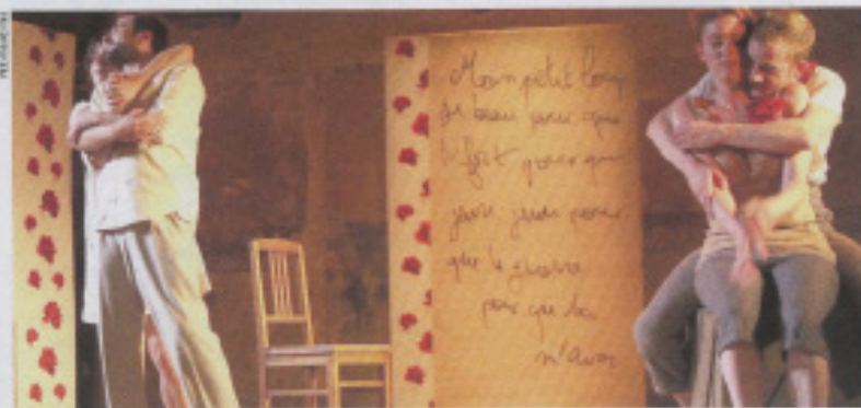
Un poème visuel inspiré de Camille Claudel et d'Auguste Rodin, et résultat de réflexions littéraires poétiques.