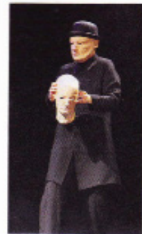
Les 19, 20, 21 mars, International Visual Theatre.