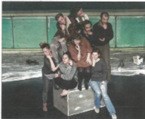
La compagnie Hippocampe ne vous laissera pas de marbre.

A priori, l'art figé de la sculpture n'a rien à faire sur une vivante scène de théâtre. A priori seulement. Car les artistes de la compagnie Hippocampe ont trouvé une brillante idée pour faire se rencontrer les deux univers. Ils sont toute la semaine en résidence au Palace, en train de mettre le point final à un spectacle dont le travail a commencé voilà un an et demi. Si tu n'étais pas de marbre... se présente comme un « poème visuel » inspiré des