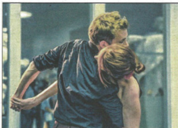
La sculpture est un art qui requiert passion et exaltation.

Si tu n'étais pas de marbre donne vie à la matière et fait cohabiter le désir de création et l'exaltation amoureuse. Un tourbillon de souvenirs libérés habite les statues qui redeviennent chaire et déclarent, à travers le mouvement, les passions qui les ont façonnées, jaillissantes